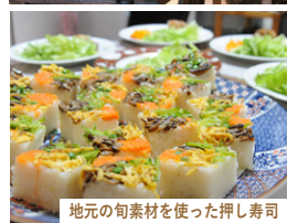
地元の旬素材を使った押し寿司

萩ゲストハウス ruco で農泊受入をしているホストファミリーのお母さんたちに集まっていた夕食交流会。郷土料理の押し寿司作りに挑戦し、移住者と、移住者を受け入れ応援してくれた人と、萩暮らしについて話しつつ、地元の味を楽しみます。