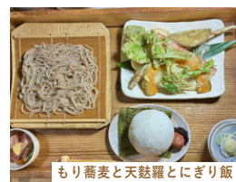
もり蕎麦と天麩羅とにぎり飯

地元産のそばを使った大人気のお店「さるのこしかけ」。種を蒔くところからこだわりの、石臼で挽いて手打ち。店内も大将の手作りです。